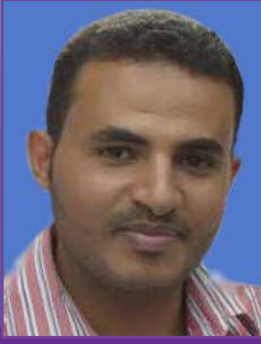
بقلم رئيس التحرير