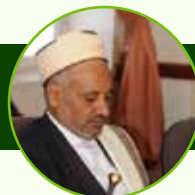
القاضي/ هزاع عبدالله عقلان