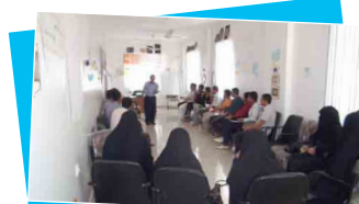
دورة كيف تؤسس مشروعك