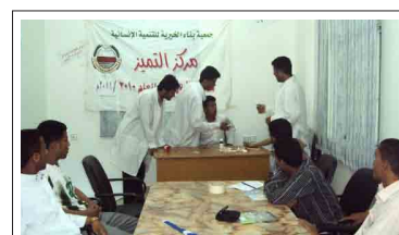
جانب من أنشطة وفعاليات مركز التميز - قسم الطلاب