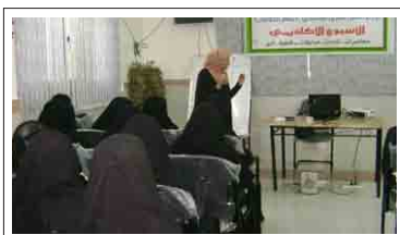
جانب من أنشطة وفعاليات مركز التميز - قسم الطالبات