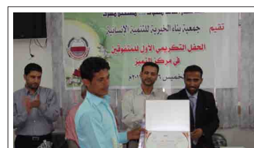
تكريم المتفوقين في الجامعة من مركز التميز