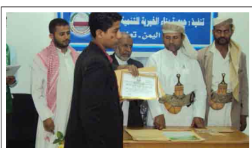
توزيع الجوائز في حفل اختتام المراكز الصيفية