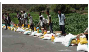
مشروع إعانة الأسر الفقيرة