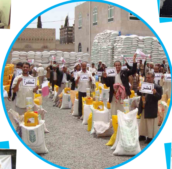
مشروع إعانة الأسر المتضررة من الأحداث