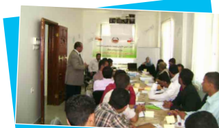
دورة التجارة الإلكترونية