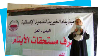
مشروع كفالة الأيتام