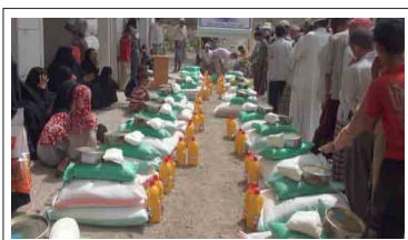
مشروع الطرود الغذائية