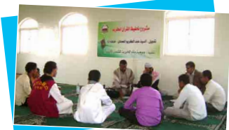
مشروع تحفيظ القرآن الكريم