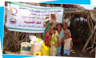
مشروع إعانة الأسر المتضررة من الأحداث

نظراً للوضع المائي الذي تعيشه تعز خاصة وعدد من مديرياتها وقرائها فقد قامت الجمعية خلال العام ٢٠١١م بتنفيذ مشروع خزان مياه في منطقة ماوية والتي تعاني من شحة المياه وعدم توفرها إلا بشق الأنفس وبلغت تكلفة تنفيذ المشروع (٨,٠٦٩,٢٠٠ ريال) يستفيد منه مايقارب (٢٠٠منزلاً) بتمويل ودعم من قطر الخيرية .