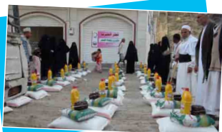
مشروع زكاة الفطر