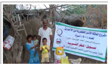
مشروع إعانة الأسر المتضررة من الأحداث