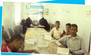
دورة في التصوير والمونتاج