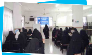
مشروع المراكز الصيفية